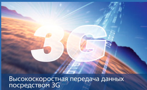
Высокоскоростная передача данных посредством 3G