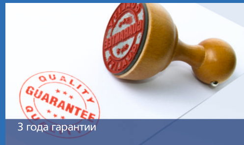
3 года гарантии