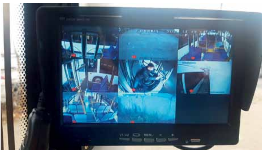
Рис. 3. Монитор в кабине водителя, на который выводятся данные с камер

Набор функций IT-комплекса от «ЕвроМобайл» этим не ограничивается. Например, в других проектах специалисты компании устанавливали систему кругового обзора и систему ADAS (от англ. Advanced driver-assistance systems – усовершенствованные системы помощи водителю). «ЕвроМобайл» может оборудовать транспортное средство полным набором современных систем, превращающих его в удобный и безопасный транспорт нового поколения.