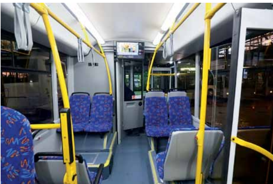
Рис. 4. Система визуального информирования пассажиров в автобусе: медианель