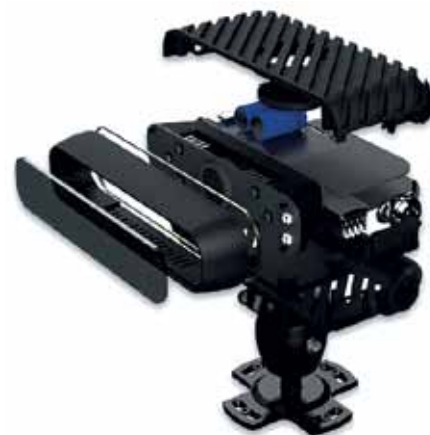
Рис. 5. Система контроля усталости водителя MDSM-7

В частности, компания разработала бюджетную линейку видеорегистраторов и видеокamer под торговой