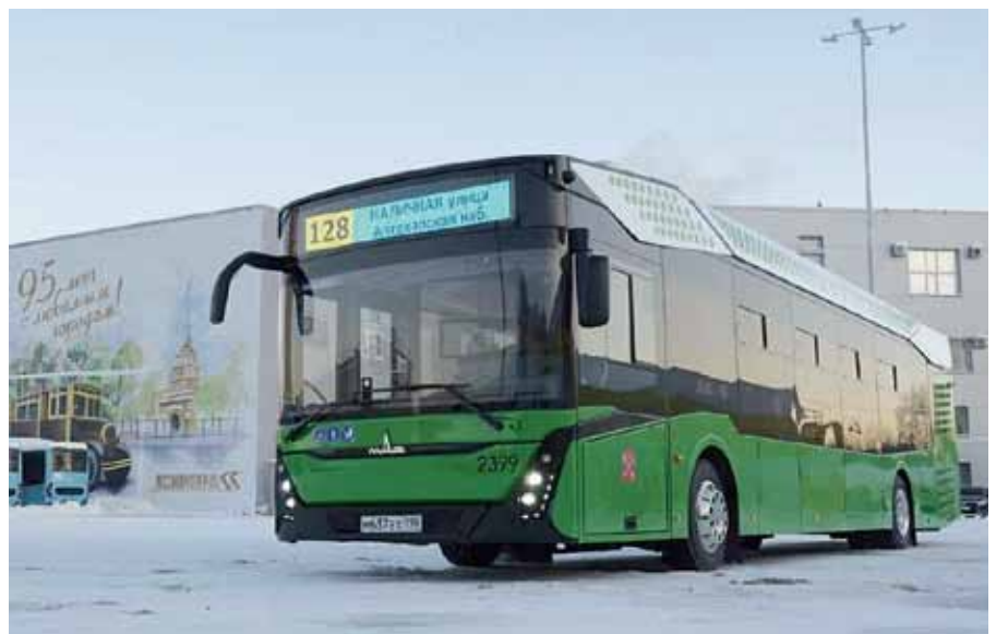
Рис. 1. Электробус, оснащенный информационно-коммуникационной системой «ЕвроМобайл»

Набор задач, выполняемых IT-системой для транспорта и дорожной инфраструктуры, определяется заказ-