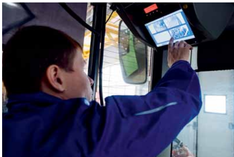
Рис. 2. Элементы системы видеонаблюдения: камера и монитор в кабине водителя, на который выводятся данные с камер