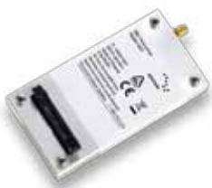
Модем Иридиума 9601 SBD

Современные критически важные приложения от компании Иридиум тщательно испытаны в самых суровых условиях, известных человеку – от студеной Арктики до экваториальных пустынь, от летящих высоко в небе самолетов до роботизированных подводных планеров.