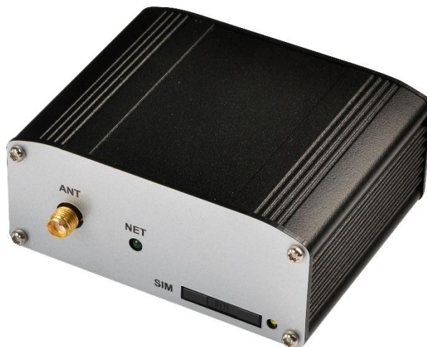
Рисунок 1-1 Внешний вид модема

3G модем Позитрон М 3G USB исполнение Е1 (далее 3G модем) – это компактный модем для передачи данных в GSM/3G-сетях. Модем имеет стандартный USB-интерфейс и слот для SIM-карты. Поддержка HSDPA, HSUPA делает модем высокоскоростным решением для передачи данных. К ключевым особенностям относится возможность программирования на языке Java.