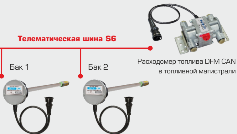
Датчики уровня топлива DUT-E CAN в баках