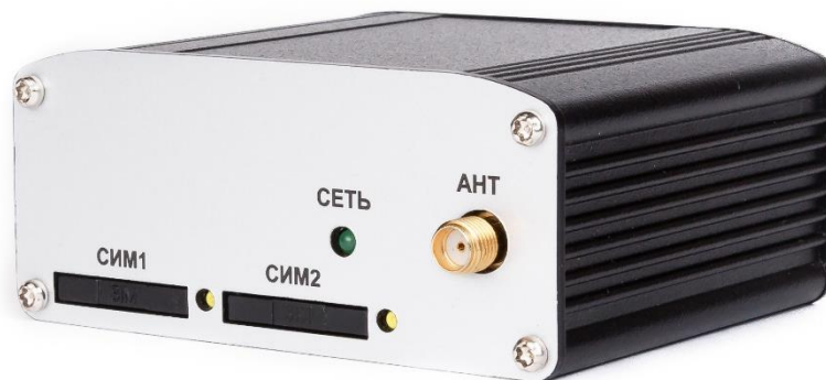
Рисунок 1 Внешний вид модема

3G модем Позитрон М 3G USB исполнение Е3.4 (далее 3G модем) – это компактный модем для передачи данных в GSM/3G-сетях. Модем имеет стандартный USB-интерфейс, 2 слота для SIM-карт, интерфейс RS-485, 1 ADC, 1 DO, 2 DI, управляемый Watchdog. Поддержка HSDPA, HSUPA делает модем высокоскоростным решением для передачи данных. К ключевым особенностям относится возможность программирования на языке Java.