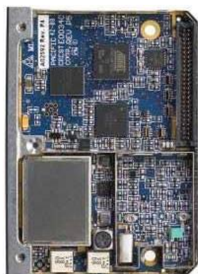
Вид снизу со снятой крышкой