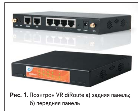
Рис. 1. Позитрон VR diRoute а) задняя панель; б) передняя панель

В связи с применением маршрутизаторов в подобных системах все чаще предъявляются повышенные требования к надежности и степени «готовности» каналов связи, поэтому в последнее время на рынке наблюдается тенденция к двойному резервированию проводных каналов. Такие решения позволяют повысить надежность связи, обеспечивая резервирование проводного канала беспроводным (через сотового оператора), при этом