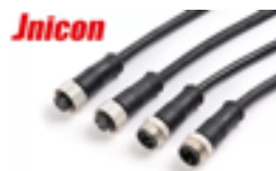
Разъемы типа M