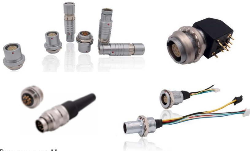
Разъемы типа M

Шэньчжэнь MOCO Interconnect Co., Ltd один из ведущих производителей двухтактных разъемов. Компания основана в 2012 году и стабильно развивается. Благодаря отличному управлению и огромным усилиям, предпринятым в течение последних нескольких лет, разработано множество популярных продуктов, таких как точные круглые двухтактные соединители, байонетные соединители YLN и высококачественные кабельные сборки. В компании всегда готовы к изготовлению нестандартных изделий. Соединители MOCO отличаются стабильной производительностью и привлекательным дизайном, поэтому они взаимозаменяемы с международными брендами. Продукты Мосо, широко используются в военной, медицинской, измерительной, аудио-видео, навигации, безопасности, авиации, промышленном управлении, автомобилестроении, энергетике.