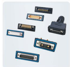
Разъемы типа D-SUB