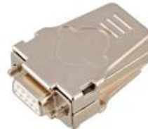
Разъемы типа D-SUB