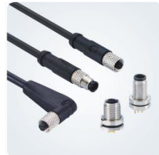
Разъемы типа M5-23