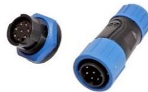
Разъемы типа M