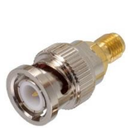
Разъемы типа UHF

Компания стремится предоставлять высококачественную продукцию на внутренний и международные рынки, произведенную в соответствии с международными стандартами для отраслей в области электричества, электроники, освещения, связи, автоматического управления, машиностроения, железнодорожного транспорта и цифровой периферии.