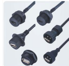
Разъемы типа USB