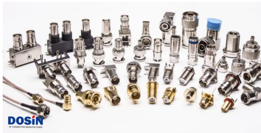
Разъемы типа UHF

Наша компания занимает площадь более 3000 квадратных метров с хорошо оборудованными цехами, автоматическими производственными линиями и сотнями рабочих. С момента основания продукты и услуги Dosinconn, получили хорошую репутацию в стране и за рубежом. На данный момент производитель имеет деловые отношения во многих странах, 70% продукции продается по всему миру.