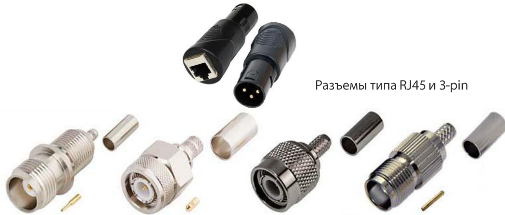
Разъемы типа RJ45 и 3-pin

Также FBELE производит, динамики, клеммные колодки, пьезоэлементы, переключатели, предохранители и держатели предохранителей.