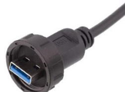
Разъемы типа USB