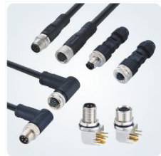
Разъемы типа M5-23

Кроме того, компания продолжает расширять товарный портфель, разрабатывая индивидуальные продукты для различных приложений, которые охватывают не только двухтактные и промышленные разъемы, но также электронные соединения и сети передачи данных. Производственная мощность FineCables уже составляет более 50 миллионов единиц продукции в год.