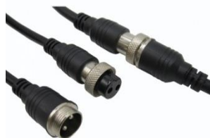
Разъемы типа M