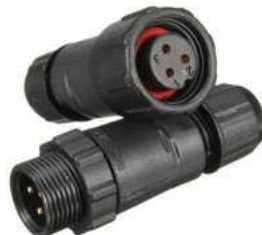
Разъемы типа M