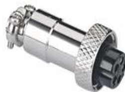
Разъемы типа M