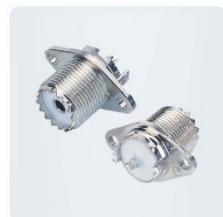
Разъемы типа UHF