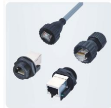
Разъемы типа RJ45