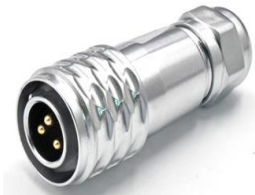
Разъемы типа M