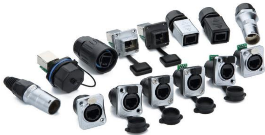
Влагозащищенные разъемы типа RJ45

В 2016 году компания была внесена в список «Национальных высокотехнологичных предприятий».