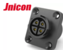
Силовой разъем 20A