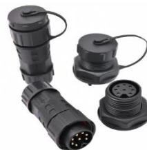
Разъемы типа M