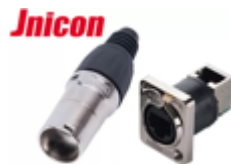
Разъемы типа RJ45