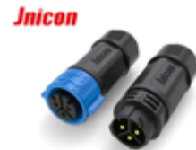
Разъемы типа M