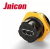
Разъемы типа HDMI